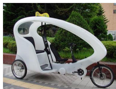
無料の自転車タクシー(ペロタクシー) 電子科学研究所 ↔ 北18条門

「お車でのご来場はご遠慮ください(入構できません)。 公共交通機関をご利用ください。」