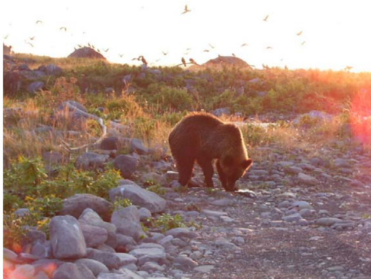
図1：サケを食べるヒグマ

分析の結果、ヒグマの食性は時代経過に伴って肉食傾向から草食傾向に大きく変化していたことが明らかになりました（図2）。道東地域ではサケの利用割合が19%（Period 1）から8%（Period 3）まで減少し、陸上動物（エゾシカや昆虫）の利用が64%から8%にまで減少していました。また、道南地域では陸上動物の利用割合が56%（Period 1）から5%（Period 3）まで減少していました。窒素同位体比値の時間的変化から、この大規模な食性の変化は、概ねここ200年の間に急激に進行したことが示されました（図3）。約200年前というのは、明治政府による開発が本格化した時期と一致しています。