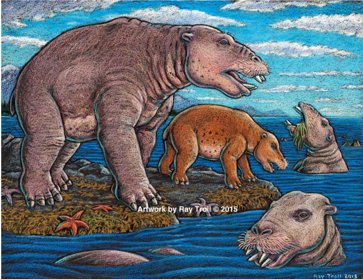
図1 新属新種のデスモステルス類 オウナラシュカステルス・トミダイの生態復元図 (レイ・トロル氏提供)

デスモステルス類は、漸新世から中新世(約 3,300 万年から 1,000 万年前)にかけて、北太平洋沿岸に生息していた一見カバのように見える哺乳類の1グループです(図1)。デスモステルス類は、柱を束ねたような現生の哺乳類には見られない奇妙な歯を持ち、その子孫がすべて絶滅してしまっていることから、その生態は今なお謎に包まれています。今回、米国と日本から発見された、デスモステルス類の進化とその生態の解明に大きく寄与する標本を Historical Biology 誌にて報告しました。