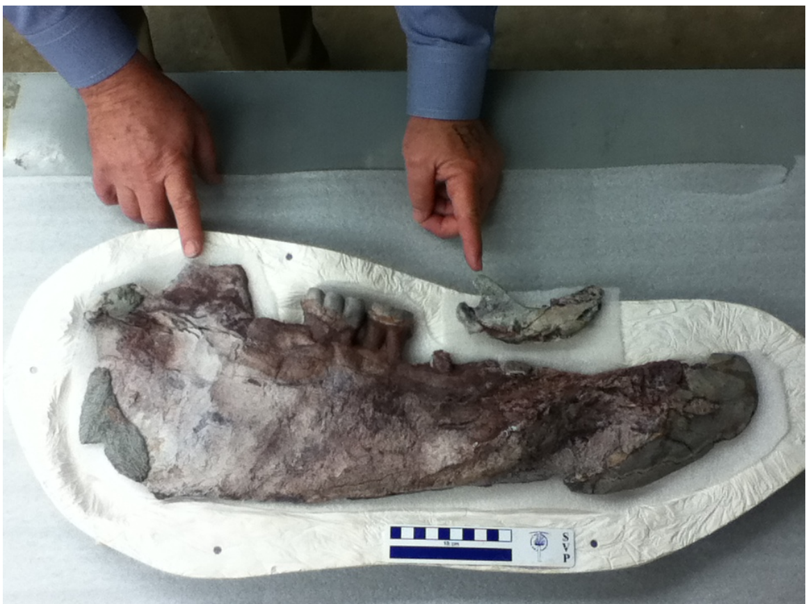
図3 新属新種のデスモスチルス類 オウナラシュカスチルス・トミダイの下顎標本 (幼体と成体)