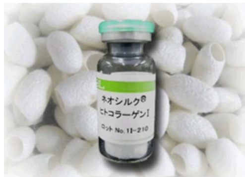
図1. 遺伝子組換えカイコにより生産されたヒトコラーゲン。本製品は、株式会社免疫生物研究所より販売されている。