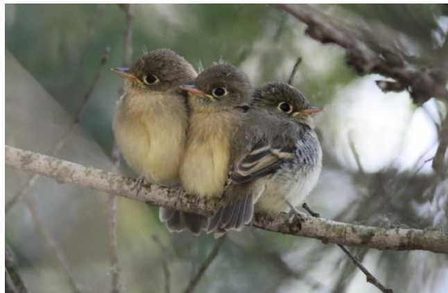
騒音により繁殖成功率が低下していた森林性鳥類（キノドメジロハエトリ）の巣立ち雛

なお、本研究成果は、2020 年 11 月 11 日（水）公開の Nature 誌にオンライン掲載されました。