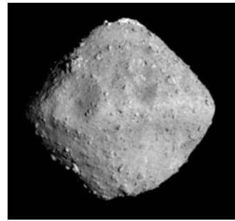
図2. はやぶさ2が試料を回収した小惑星

隕石は小惑星から飛来した物質で、一部の隕石は約46億年前に生成したアミノ酸や糖などの生命の材料となる有機物を含んでいます。そのため、隕石に含まれる有機物が生命誕生前の地球に飛来して、生命の材料となった可能性が指摘され、JAXAの探査機はやぶさ2やNASAの探査機OSIRIS-Rexによって精力的に探査が行われています(図2)。しかし、隕石に含まれる有機物が、どのような材料からどのような反応で生成したのかは、多くの可能性があつてこれまで明らかになっていませんでした。