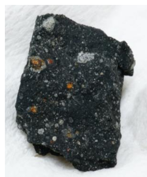
図 1. アミノ酸, 糖, 不溶性有機物を含む

本研究成果は、2021年4月29日に米国科学振興協会(AAAS)が発行する『 Science Advances 』で公開されます。