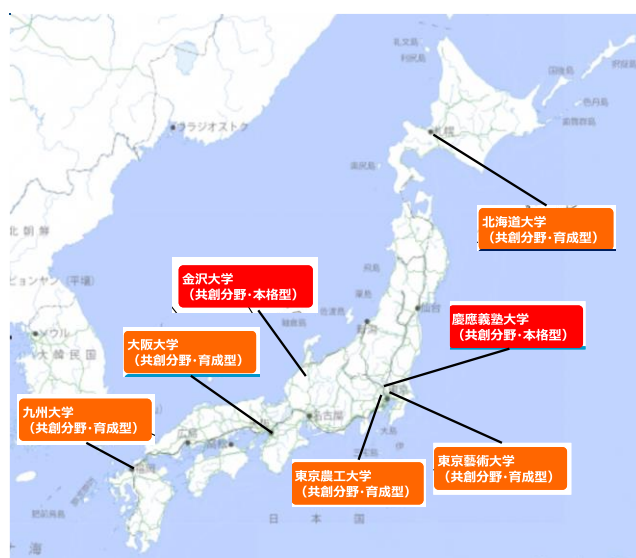
図1 令和3年度 JST 共創の場形成支援プログラムに採択された拠点。赤色は「本格型（10年）」、オレンジ色は「育成型（2年）」。