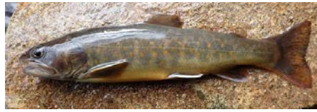
太平洋型（ヤマトイワナ）