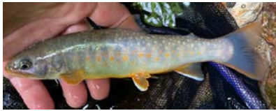
日本海型（ニッコウイワナ）