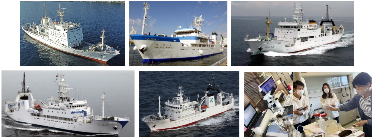
図1 4大学練習船と九州大学のMPs分析室：左上から海鷹丸・神鷹丸・おしよろ丸・長崎丸・かごしま丸・MPs分析室