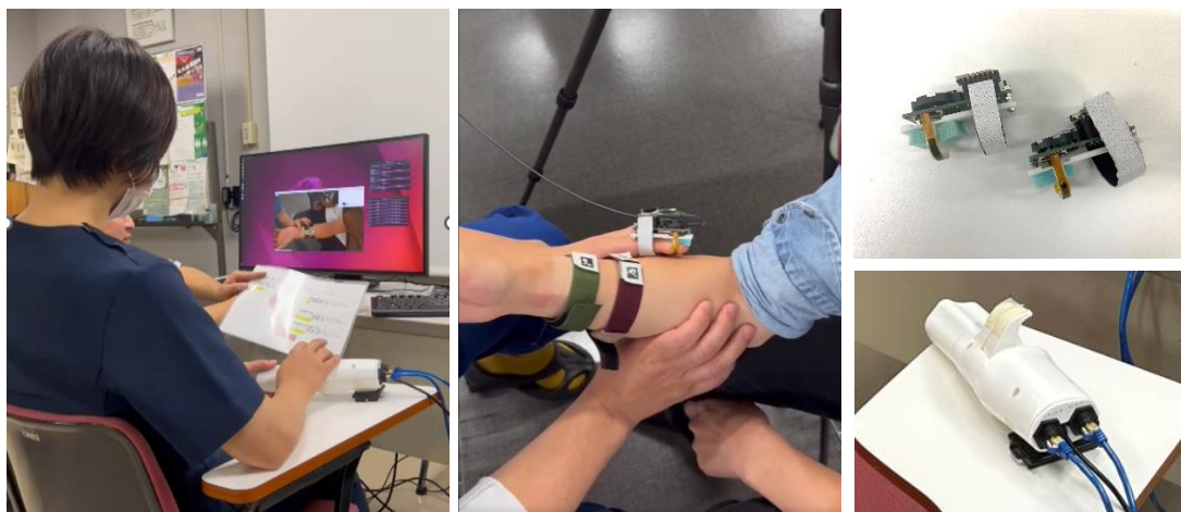
図3: 札幌、帯広、函館3拠点遠隔触診実験

本成果により、遠隔触診を一例として、サービスに応じた最適ネットワークのパラメーターの簡略化がなされ、ネットワーク・スライシングへの指針 *3 を明確化できることが示されました。