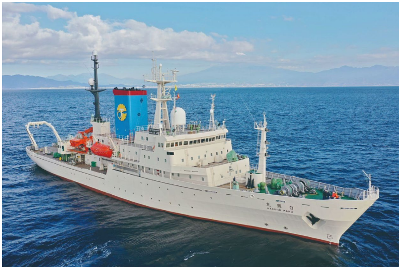
(写真 1) 学術研究船「白鳳丸」

※2 海底電位磁力計 (OBEM: Ocean Bottom Electromagnetometer) : 海底地震計と同様、船舶により海底に設置し、一定期間磁場及び電場を測定する。取得した磁場及び電場データから海底下の電気の流れやすさを可視化し、流体の分布を把握することができる。