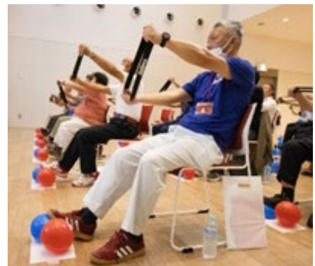
過去に実施した体操の様子

5月19日(日)のグッドドライバー・チェックでは、安全に運転するためのセルフチェックやアクセルとブレーキの踏み間違い防止体操及び75歳以上の方の運転免許の更新に必要な認知機能検査を体験できます。